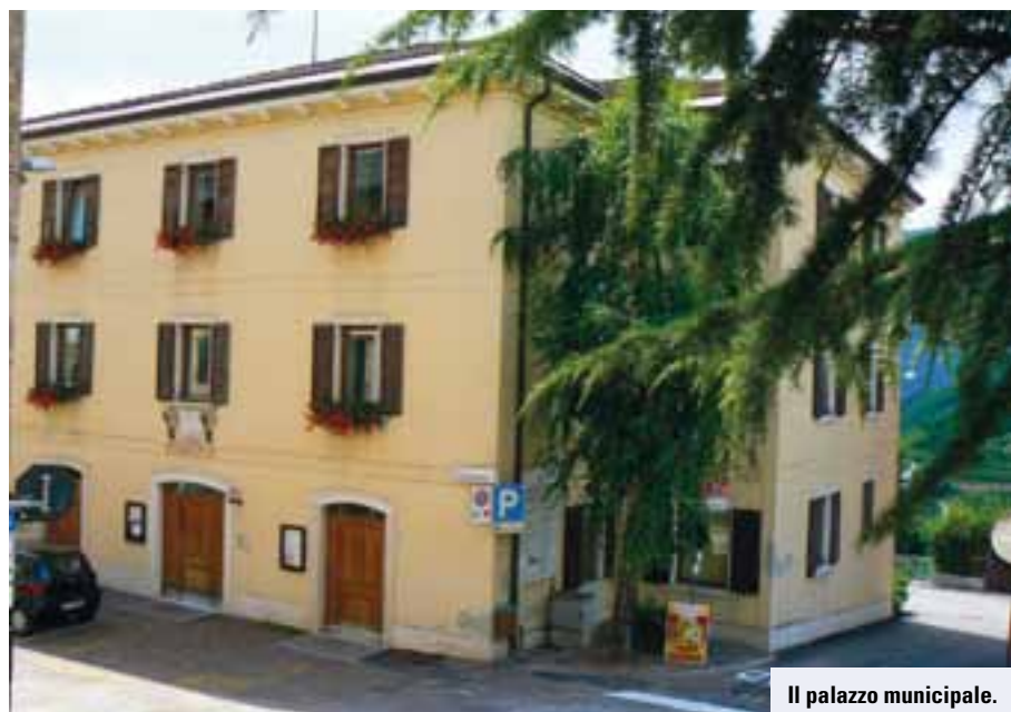
Il palazzo municipale.

Altro intervento che merita attenzione è la recente sostituzione dell'intero impianto telefonico e del centralino comunale che è costata circa 6.000 euro e che si è conclusa nei mesi scorsi, che ha arricchito la struttura grazie ad un servizio completo e all'avanguardia.