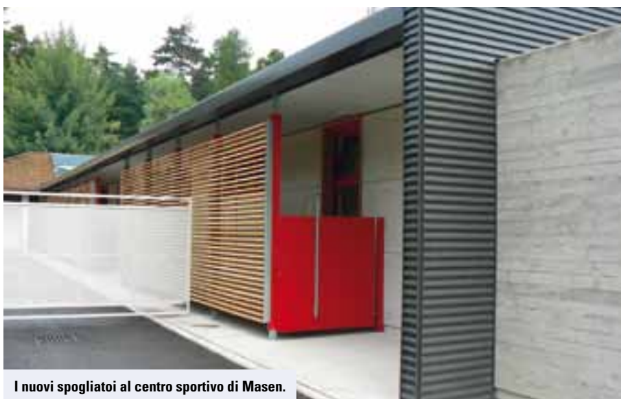
I nuovi spogliatoi al centro sportivo di Masen.

Sempre a Masen, domenica 5 giugno si sarebbe dovuta svolgere la Giornata dello Sport. A causa delle incerte condizioni meteorologiche che non permettevano la buona riuscita dell'evento, si è deciso di annullare la manifestazione, con la volontà comunque di non perdere ciò che la giornata dello sport rappresenta, ovvero, e cito uno spot del Coni: "La vita ti mette in gioco. Tutti i giorni. Allora impara a giocare facendo sport. Metterai in pratica valori importanti come l'amicizia, la tolleranza, la solidarietà, l'autodisciplina, la responsabilità, il gioco di squadra. Scoprirai che lo sport insegna a diventare grandi. E non solo ai piccoli, ma anche a chi grande lo è già" e di riprendere l'evento con una formula diversa nel periodo autunnale.