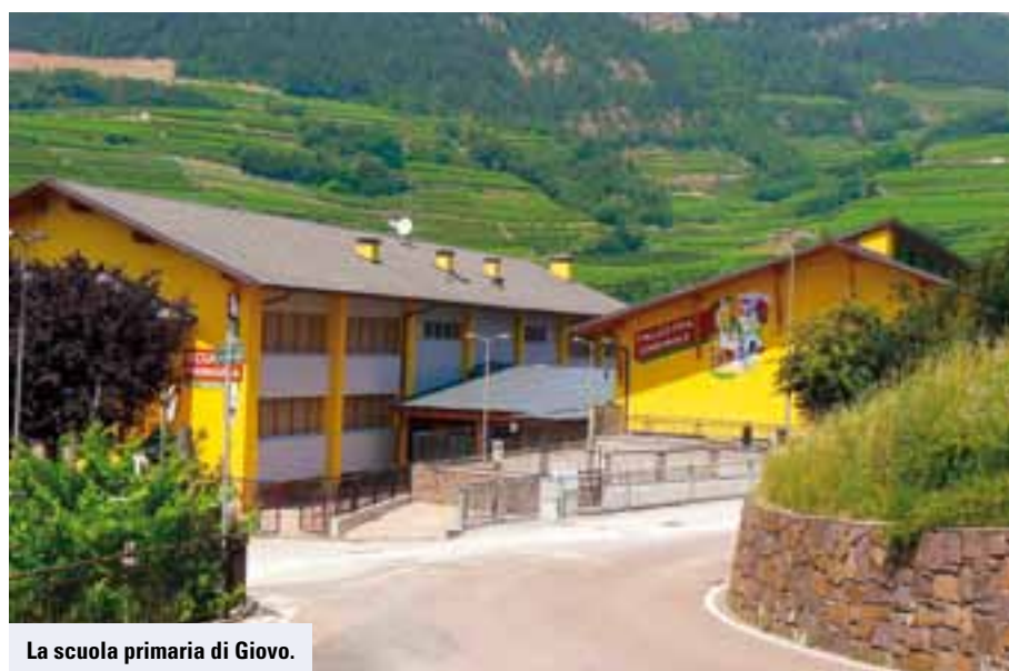
La scuola primaria di Giovo.

Mi auguro che proprio voi, genitori abbiate fiducia in tutte questi soggetti che fanno sinergia e dialogano tra loro, certe volte non senza difficoltà, ma lo fanno per ottimizzare tutte le varie componenti che fanno di questa scuola di Giovo un ottimo esempio di cui andare fieri.