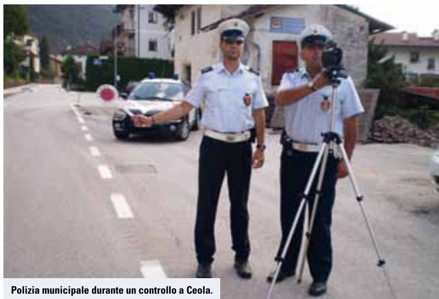
Polizia municipale durante un controllo a Ceola.