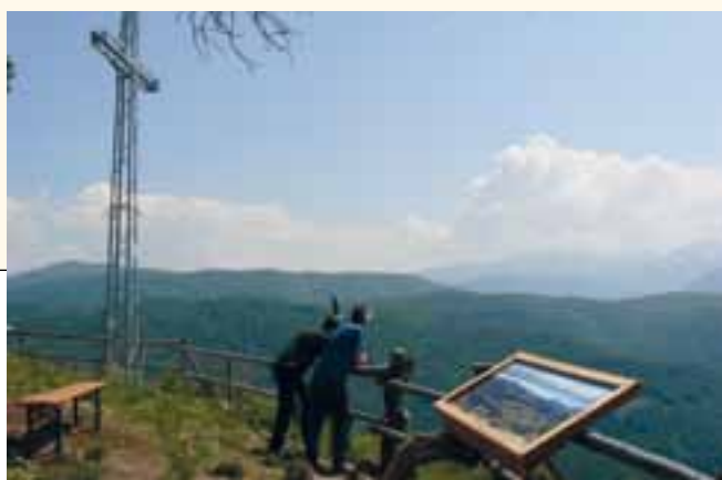
La splendida veduta dal Doss Paion.