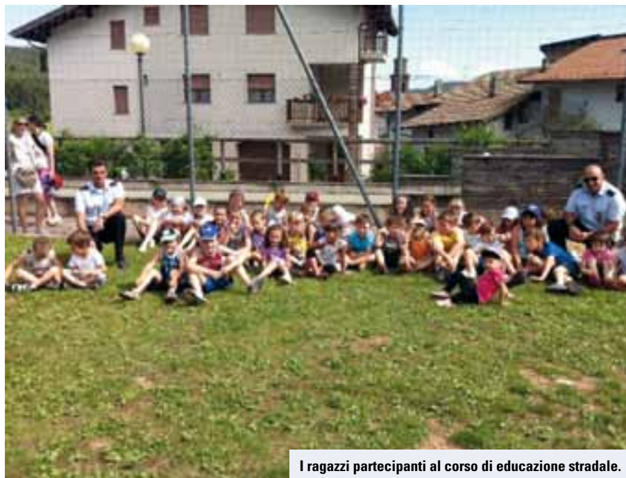
I ragazzi partecipanti al corso di educazione stradale.

Ricordiamo tra gli altri l'incontro del mese di marzo con la festa del papà, ad aprile la "Caccia all'uovo" tra le vie e il parco di