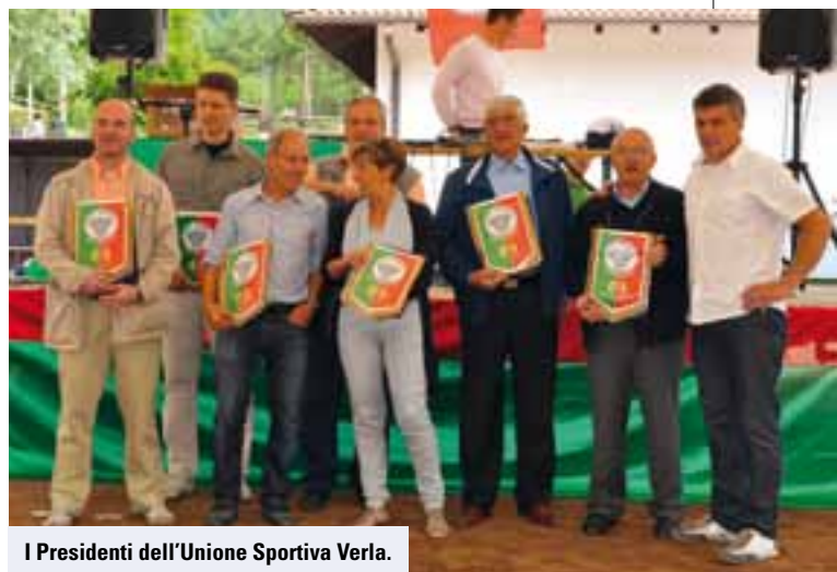
I Presidenti dell'Unione Sportiva Verla.

Dopo il pranzo (sono stati serviti oltre 430 pasti!) la dirigenza dell'US Verla ha voluto ricordare tutti i presidenti che si sono susseguiti al timone della società consegnando una targa celebrativa dell'importante traguardo raggiunto.